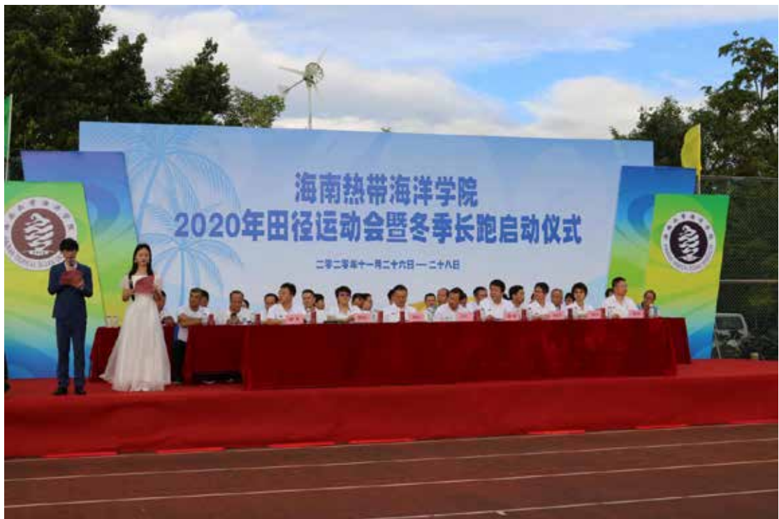
2020年11月26日，海南热带海洋学院2020年田径运动会暨冬季长跑启动仪式正式召开。