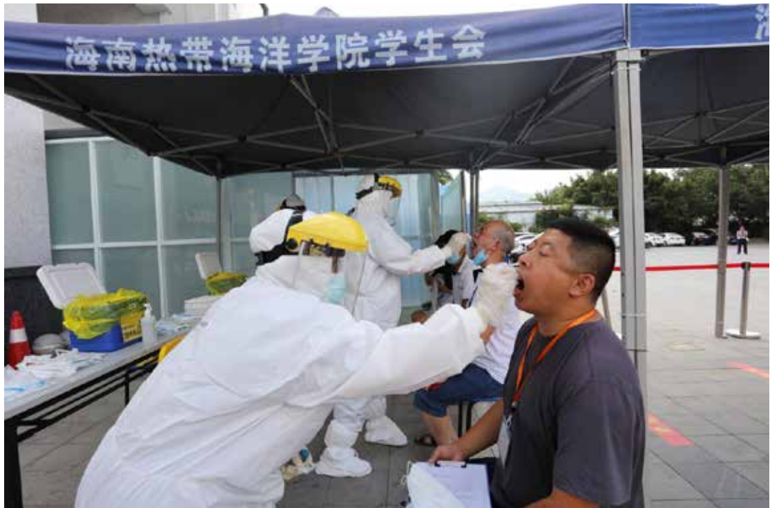
2020年5月6日，学校开展核酸检测工作。