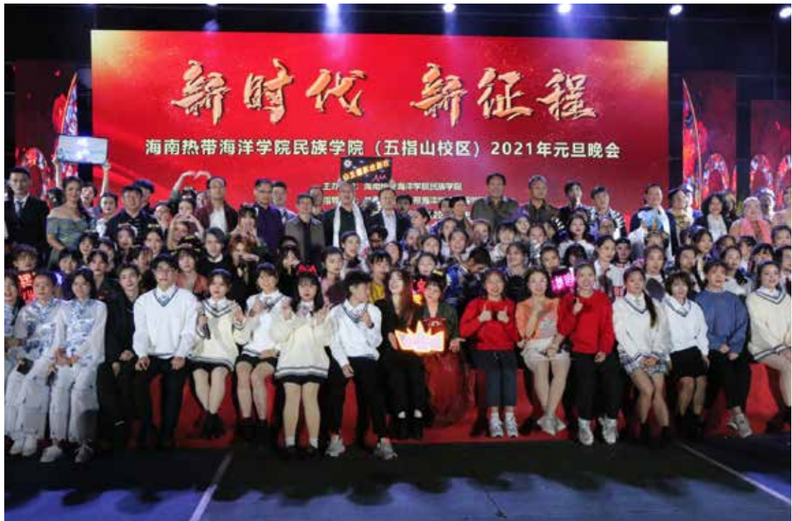
2020年12月27日,海南热带海洋学院民族学院(五指山校区)2021年元旦晚会顺利举行。