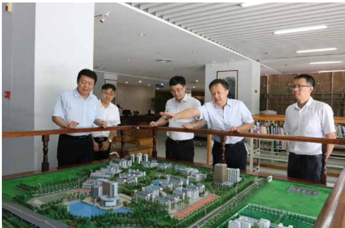
2020年9月22日，共青团中央书记处书记、全国少工委主任吴刚（右三）一行莅临海南热带海洋学院调研团学组织建设工作。