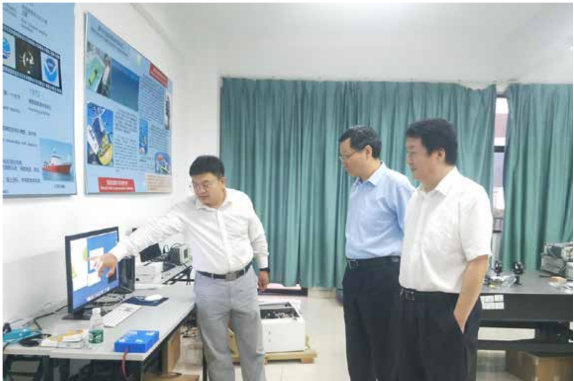
2020年11月19日，中国科学院院士王巍（中）莅临海南热带海洋学院调研指导。