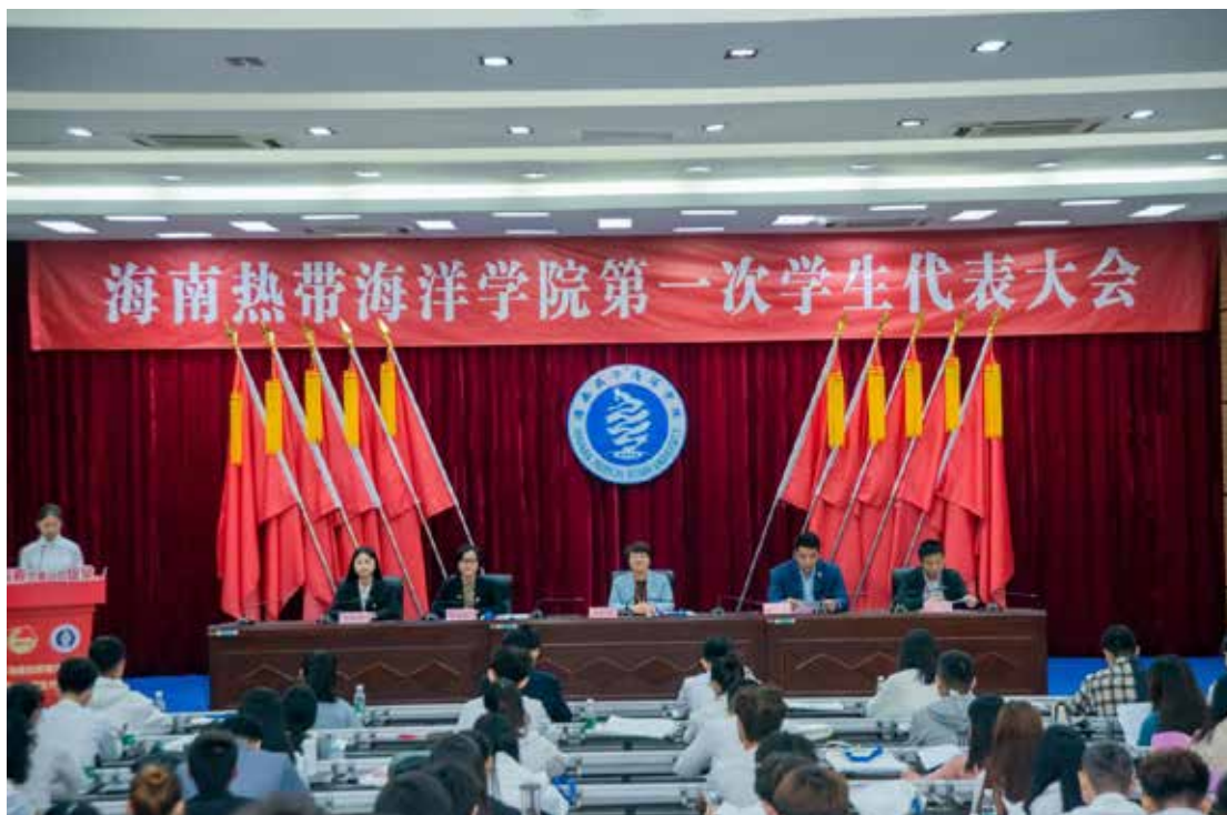
2020年12月20日，海南热带海洋学院第一次学生代表大会在三亚校区报告厅召开。