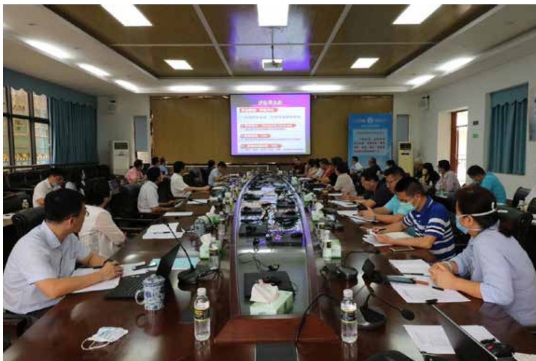
2020年4月2日，本科教学工作审核评估自评自建工作汇报会召开。