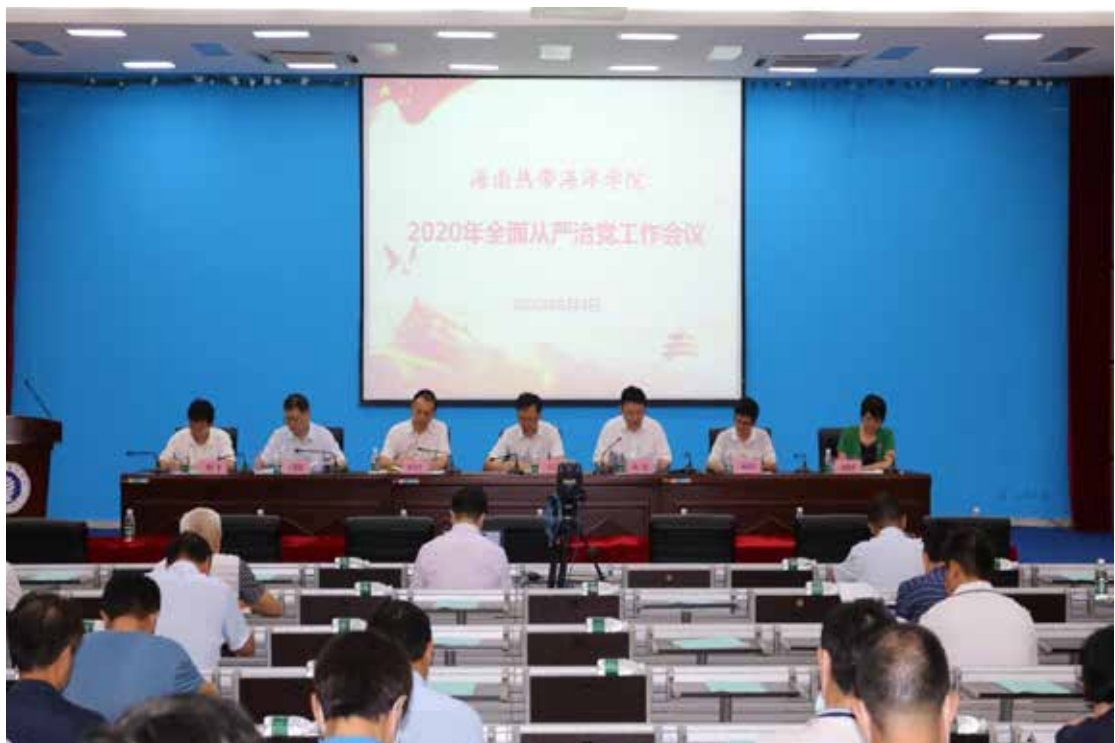
2020年6月4日，海南热带海洋学院2020年全面从严治党工作会议顺利召开。