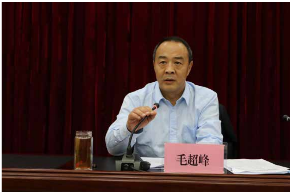
2020年11月26日，海南省委常委、常务副省长毛超峰在海南热带海洋学院宣讲党的十九届五中全会精神。