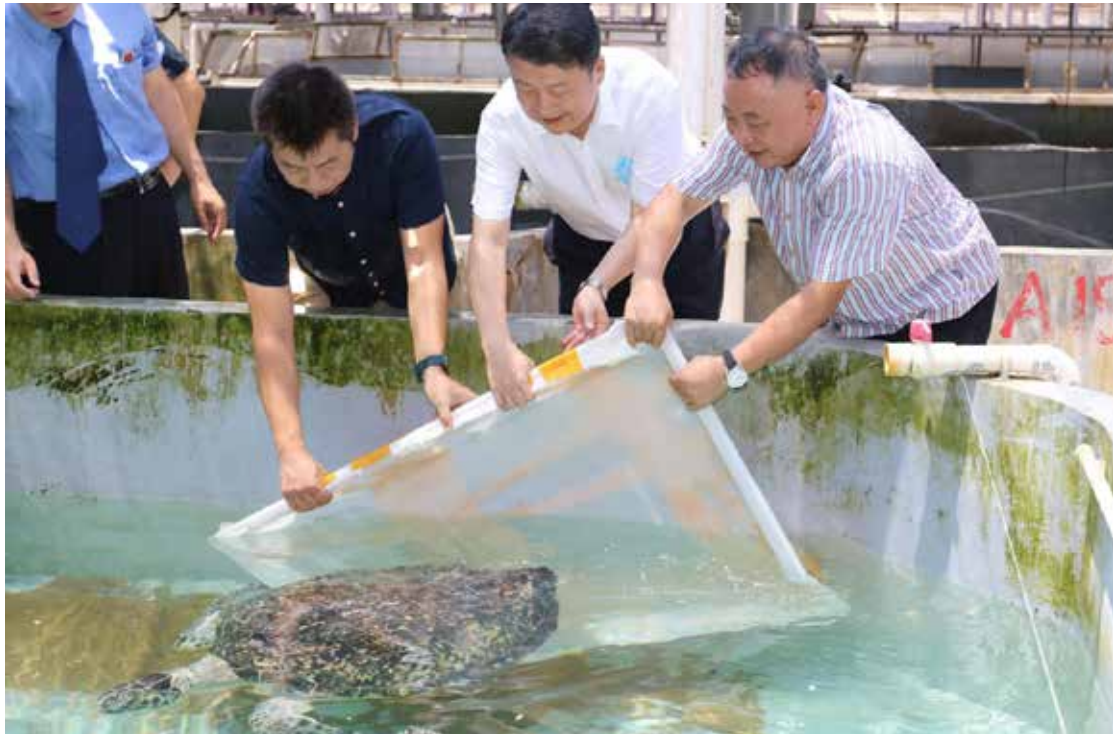
2020年6月6日，江苏省人民检察院空运移交43只涉案活体海龟给海南省两栖爬行动物研究重点实验室海龟救助保护基地暂养救治。图为海龟移交现场。