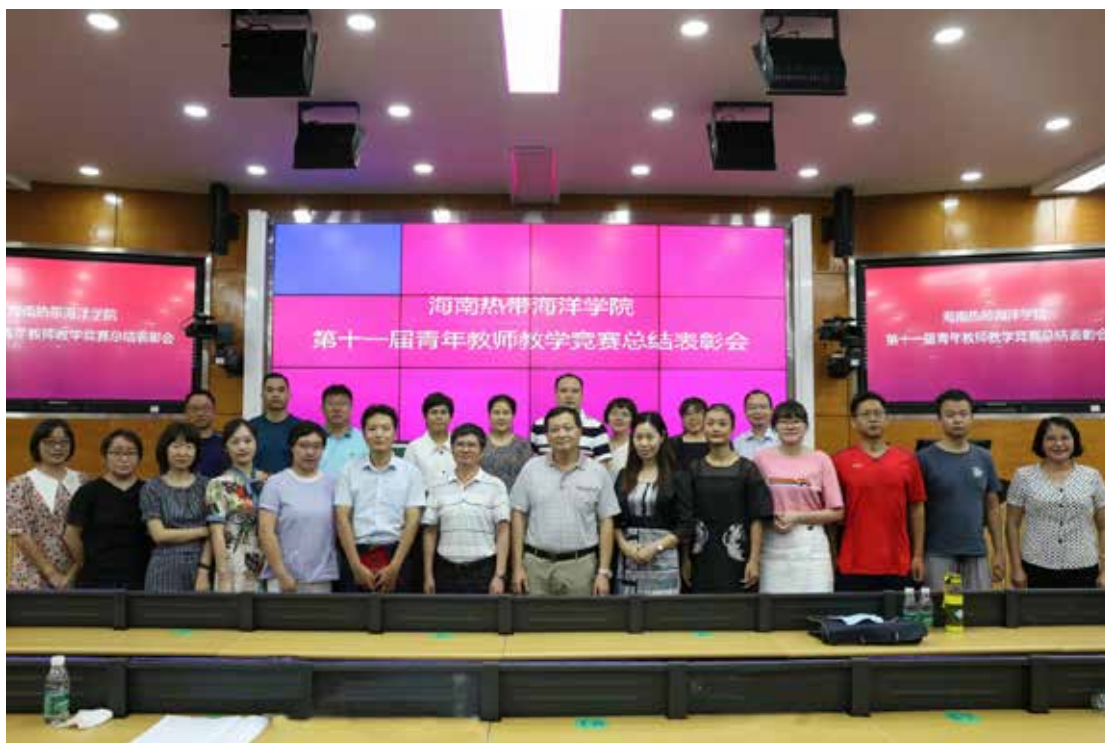
2020年7月2日，海南热带海洋学院第十一届青年教师教学竞赛总结表彰会顺利召开。