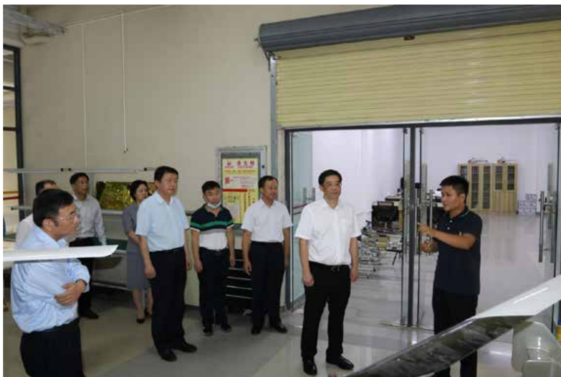
2020年11月2日，海南省委常委、组织部部长彭金辉（右二）莅临海南热带海洋学院调研。