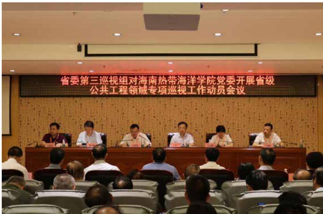
2020年10月12日，省委第三巡视组对海南热带海洋学院党委开展省级公共工程领域专项巡视工作动员会议在三亚校区图书信息中心楼举行。