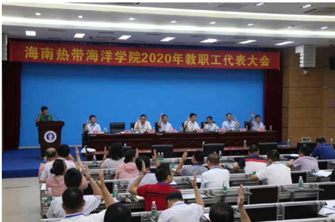
2020年7月20日，海南热带海洋学院2020年教职工代表大会在三亚校区报告厅举行。