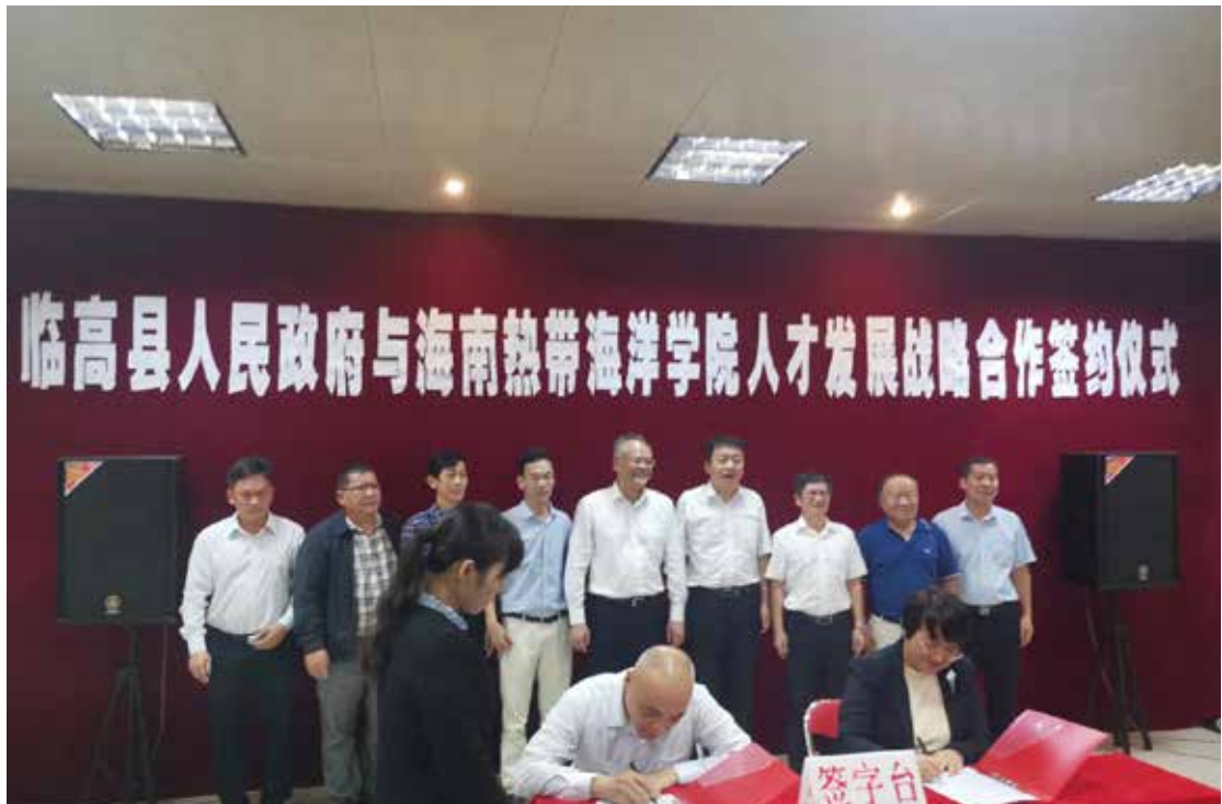
2020年10月30日，临高县人民政府与海南热带海洋学院签署人才发展战略合作协议。